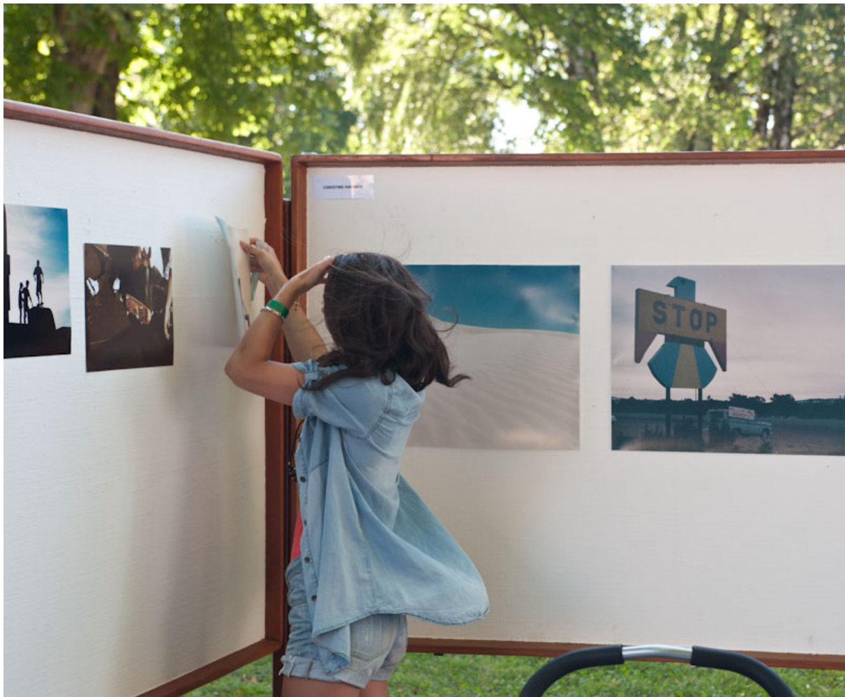
Fotografiets dag 2010.

Når fotografiets dag markeres 28. august i 2011, er det for femte gang. Arrangementet har vist seg levedyktig og kjærkomment. Som i mange faggrener, har også fotografiet ulike grener som kan ha liten forståelse for andres felt. Vi tror Fotografiets dag kan være en møteplass for de ulike synene som er med på å berike vårt forhold til fotografi, og som museum ønsker vi å legge til rette for å være en møteplass for de ulike feltene. Arrangementet har et publikumstall på rundt 1200 personer i løpet av en søndag i august.