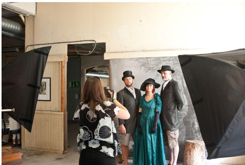
Historisk portrettstudio 2010

Fotopiknik på plenen hele dagen. Servering fra restauranttelt. Fotografforeningene har sine stands med informasjon i eget telt. Bruktmarked for fotografisk utstyr, bilder, album mv, med mulighet til å gjøre et kupp eller få solgt det du har til overs. Levende musikk fra scenen. Fotografering i historisk studio. Aktiviteter for barn. Fotografforeningene vil også ha egne arrangementer som gjør dagen spennende og innholdsrik for små og store.