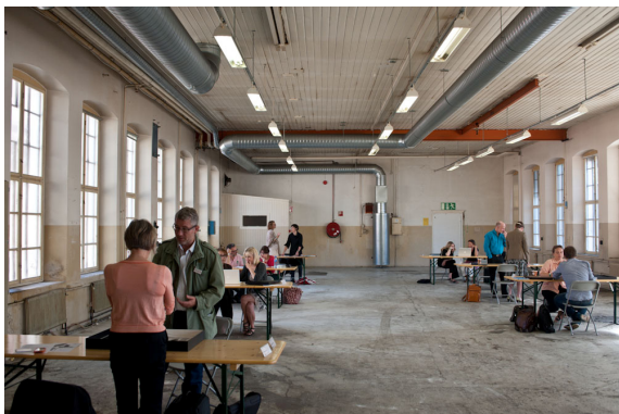
Portfolio reviewing 2010.

Bli arrangert for tredje gang, og har blitt tatt veldig godt imot av deltagere på begge sider av bordet. 6 ulike reviewere blir invitert til å se på mappene til utvalgte deltagere som på forhånd har sendt inn sine arbeider for juryering. Fotografer og reviewere møtes til forhåndsavtalte møter på 20 minutters varighet. Reviewere er museumsdirektører, kuratorer, redaktører og gallerister som gir kvalifisert tilbakemelding på fotografenes arbeider.