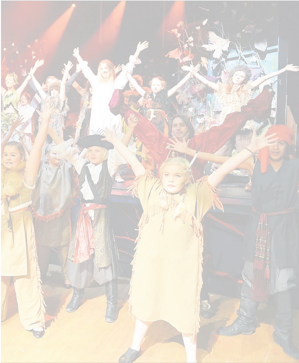
STORSATSING: 50 år etter Disney-filmen om Peter Pan, varter Kodal amatørteater opp med Peter Pan-musikal. 35 skuespillere er snart klare til premiere.