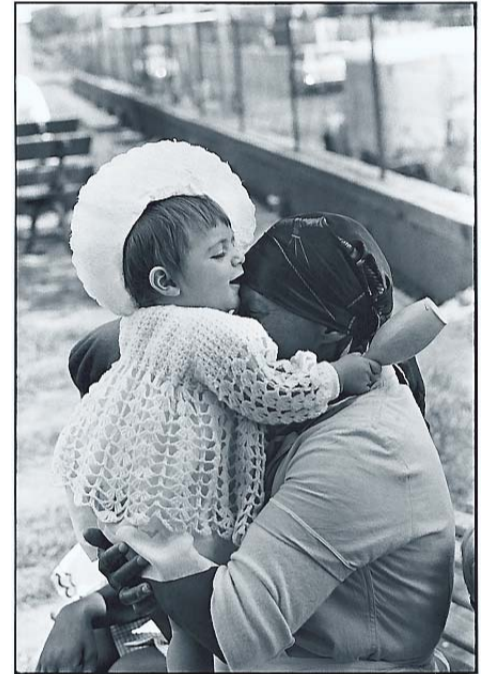
NÆRHET: «Childandnanny» av Ernest Cole.

At den franske fotografen Henri Cartier-Bresson var et forbilde for Cole, synes, især i gatemotivene. Men der han kommer nær innpå menneskene, som i serien av svarte tjenere i hvite familier, har han en unik, egen stemme, som i