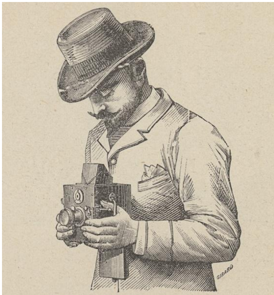
Bild för alla. Fotografiamatörer och amatörfotografer från 1860 till i dag

Fortellingen om amatørfotografiets første bølge på 1860-tallet, når alle skulle få tatt sitt portrett (noe som var en helt ny opplevelse for mange) og lære seg å kjenne igjen seg selv, sine bekjente og samtidens selebriteter med utgangspunkt i et fotografi. Vi får morsomme eksempler på hvordan dette kunne utarte seg.