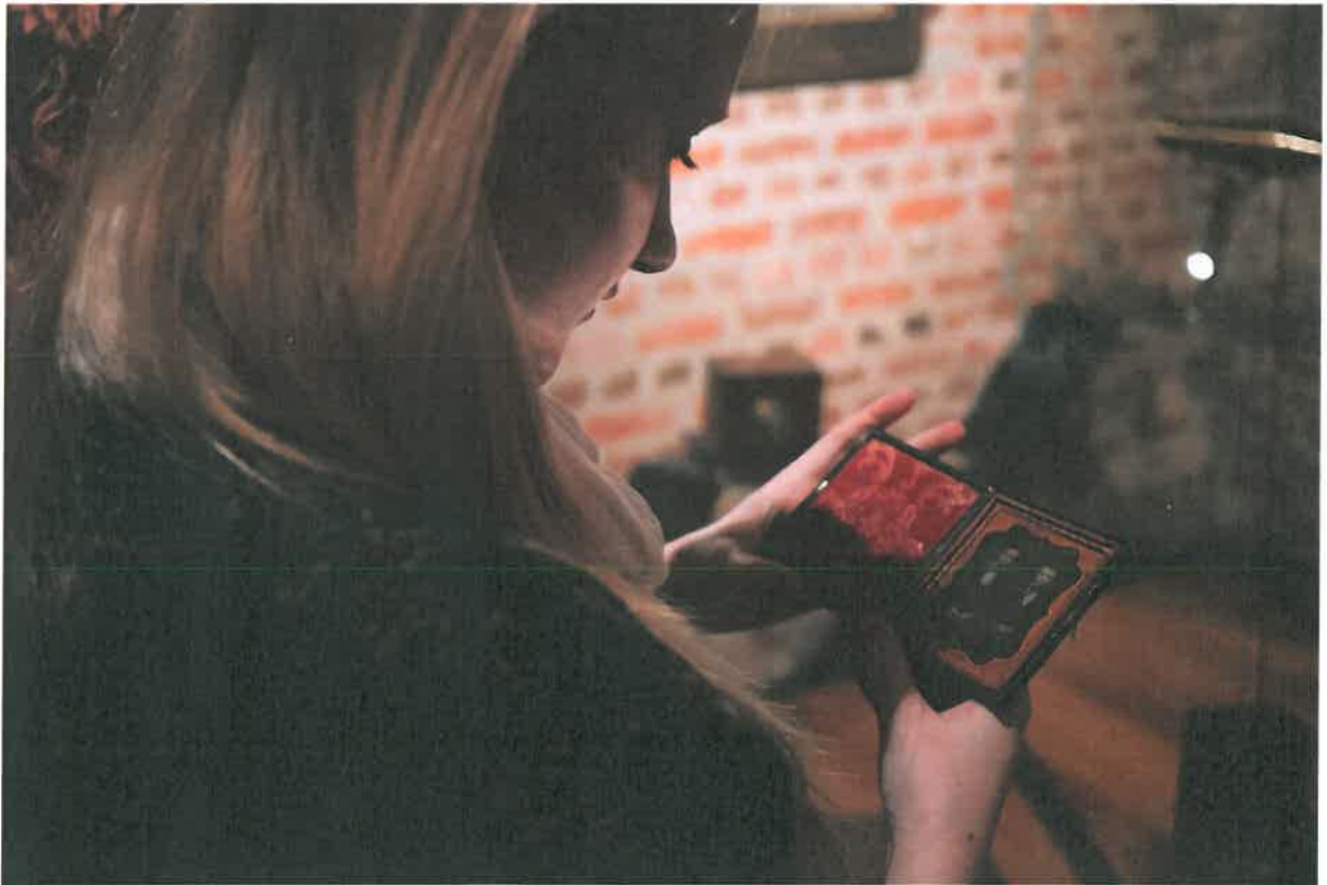
Besøkende studerer et daguerreotypi